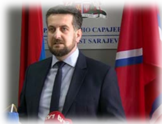
GRADONAČELNIK ISTOČNOG SARAJEVA NENAD VUKOVIĆ

U ime Univerziteta u Istočnom Sarajevu svim učesnicima Festivala želim srdačnu dobrodošlicu i ugodan boravak na našem Univerzitetu.