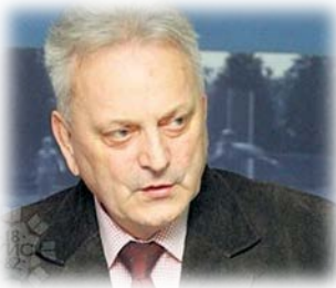
REKTOR UNIVERZITETA U ISTOČNOM SARAJEVU Prof. dr STEVO PAŠALIĆ

Internacionalni festival harmonike „Akordeon Art“ najznačajnija je umjetnička manifestacija u organizaciji Muzičke akademije i Univerziteta u Istočnom Sarajevu. Ovogodišnji „AKORDEON ART plus“, u okviru kojeg će se održati 9. Internacionalni festival harmonike i 1. Međunarodno takmičenje pijanista, ugostiće, kao i prethodnih godina, renomirane umjetnike, profesore, takmičare i goste iz brojnih zemalja svijeta, čije prisustvo govori o značaju i kvalitetu ove manifestacije.